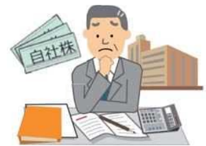
※ 減価償却資産を購入